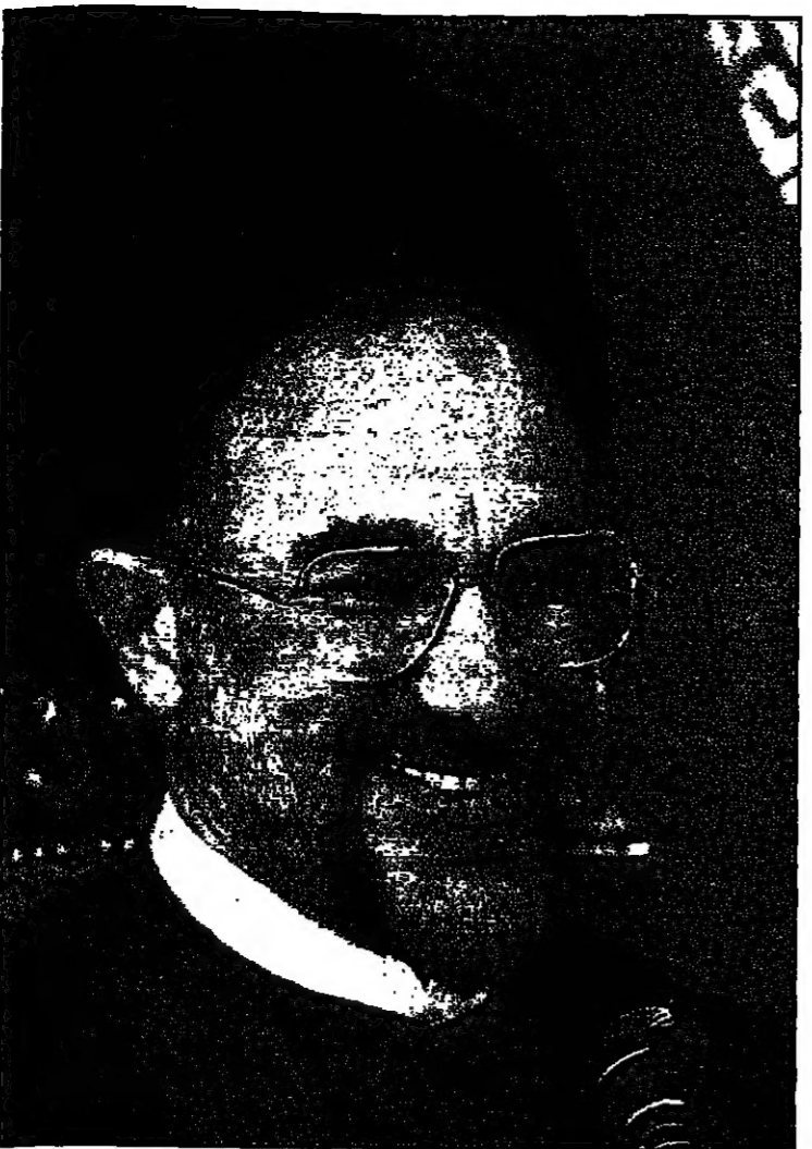
الطبيب محمد خاتمي